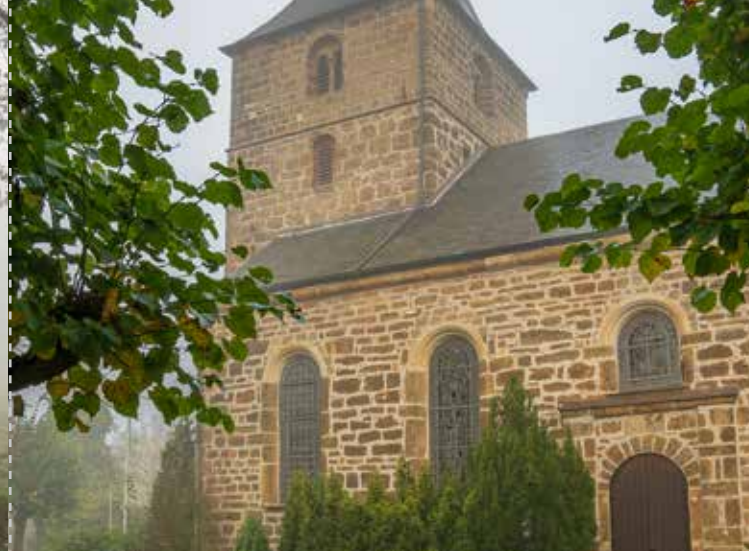
Kirche St. Urbanus

Das mehr als 800 Jahre alte Rhade liegt im südlichen Westmünsterland und ist seit 1975 ein Stadtteil Dorstens. Erste Ansiedlungen von Menschen auf Rhader Gebiet soll es vor über 6000 Jahren gegeben haben. Im Jahre 1217 wurde Rhade in der Schreibweise „Rohte“ erstmalig urkundlich erwähnt. Der Name kommt von „roden“, denn durch das Fällen von Bäumen wurde Platz für Ansiedlungen und Ackerflächen geschaffen. Auch der im Rhader Stadtteilwappen enthaltene Baumstumpf deutet auf die Entstehungsgeschichte hin. Weltlicher Herr dieser Gegend war mal ein „Herr von Lembeck“, der vom Bischof Land zum Lehen bekommen hatte. Die Gerichtsbarkeit über die umliegenden Gemeinden wurde ebenfalls von Lembeck aus ausgeübt. Die Bezeichnung dieser Macht nannte man auch Gerichtsherrlichkeit, die der Ursprung des Namens „Herrlichkeit Lembeck“ ist. 1489 kam es zur Abpfarrung von Lembeck und es entstand die Kirchengemeinde St. Urbanus mit der im Ortszentrum gelegenen Kirche. Von 1844 bis 1974 stellte die Gemeinde Rhade eigene gewählte Bürgermeister. 1975 ging Rhade mit der Kommunalen Neuordnung schließlich als Stadtteil in der Stadt Dorsten auf und dadurch erloschen die Gemeinderechte.