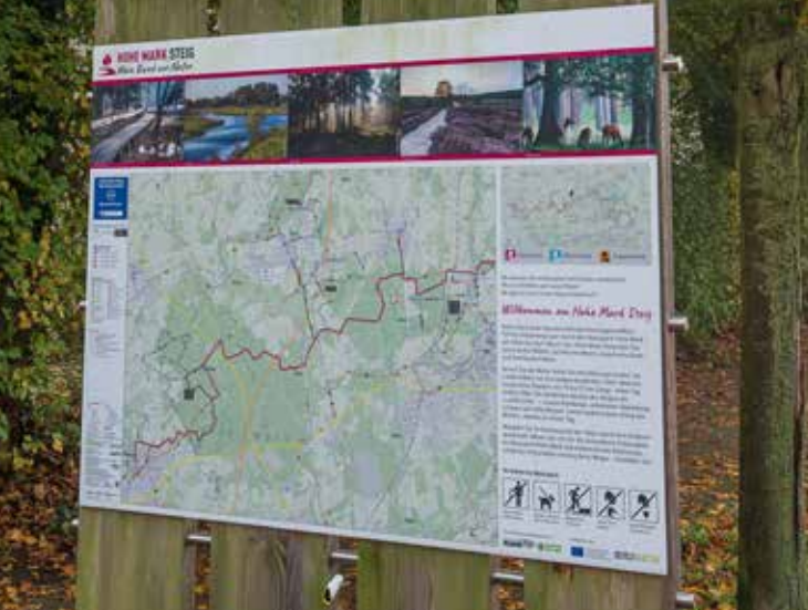
Informationstafel zum Hohe Mark Steig